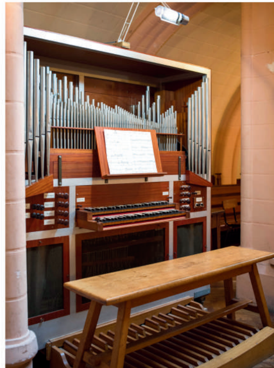
L'orgue dans le temple

Passionné très tôt par la facture instrumentale (1er orgue à 15 ans), de façon très diversifiée : il a fabriqué plusieurs orgues, un clavecin, un pianoforte, mais aussi des hautbois baroques, un violoncelle et restauré plusieurs pianos anciens. Il entretenait un compagnonnage très étroit avec de nombreux facteurs d'instruments.