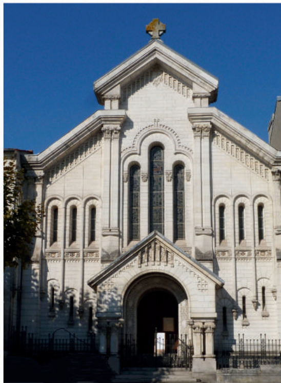
Le temple protestant