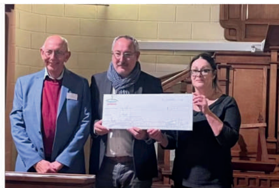
Remise du chèque de l'Association vestiaire solidaire Saintais

Un don très généreux de la part de l'Association Vestiaire Solidaire Saintais, remis lors d'un concert au mois de novembre 2025 en présence de Monsieur le maire de Saintes, nous a fortement encouragés.