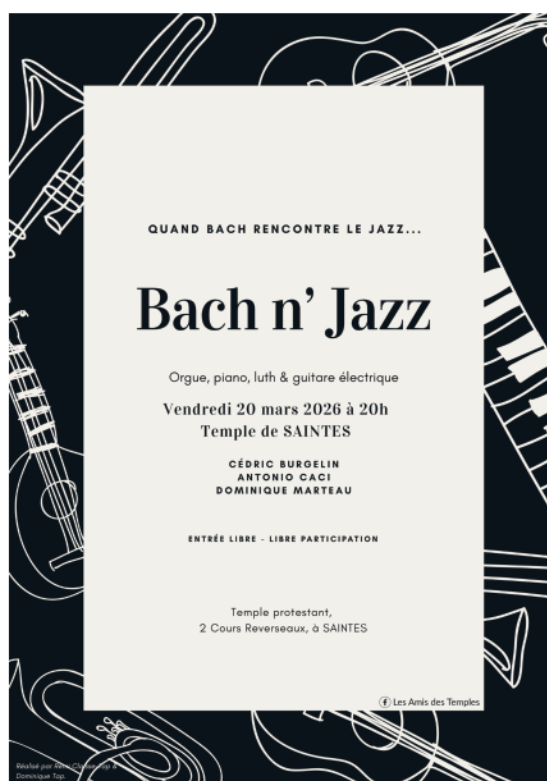
Affiche Bach au Temple ©Rémi Claisse & Dominique Tap

« Réveillez-vous, la voix du veilleur nous appelle ! » C'est un bon encouragement d'entreprendre les travaux nécessaires pour mettre cet instrument en valeur.