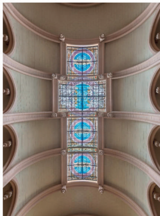
Le vitrail après sa restauration

Une de ses originalités est la verrière recouvrant la nef, en forme de croix, ornée de vitraux représentant des anges. Cette verrière, restaurée en 2022/2023, est un joyau de l'art nouveau.